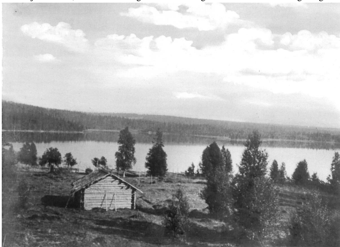
Storviksboan ca 1920